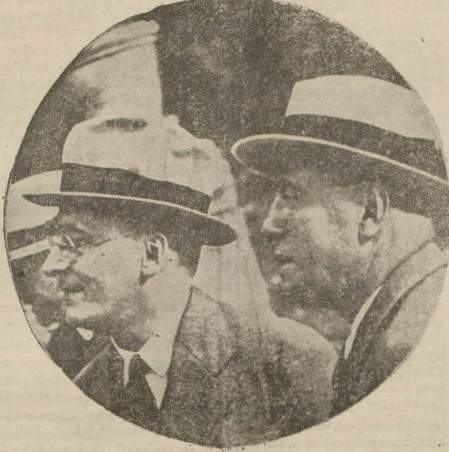
Alman Başvekili Musolini ile beraber

Aynı takdire, italyan Başve-kili Musolini de iştirak et-mektedir.