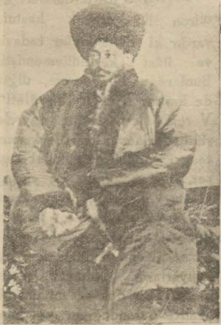
Hivenin son padişahı (hanı) Seyit Aptullah Han

kaldı. Memleket eski vezirler ve eski hâkimler tarafından eski şekilde idare ediliyordu.