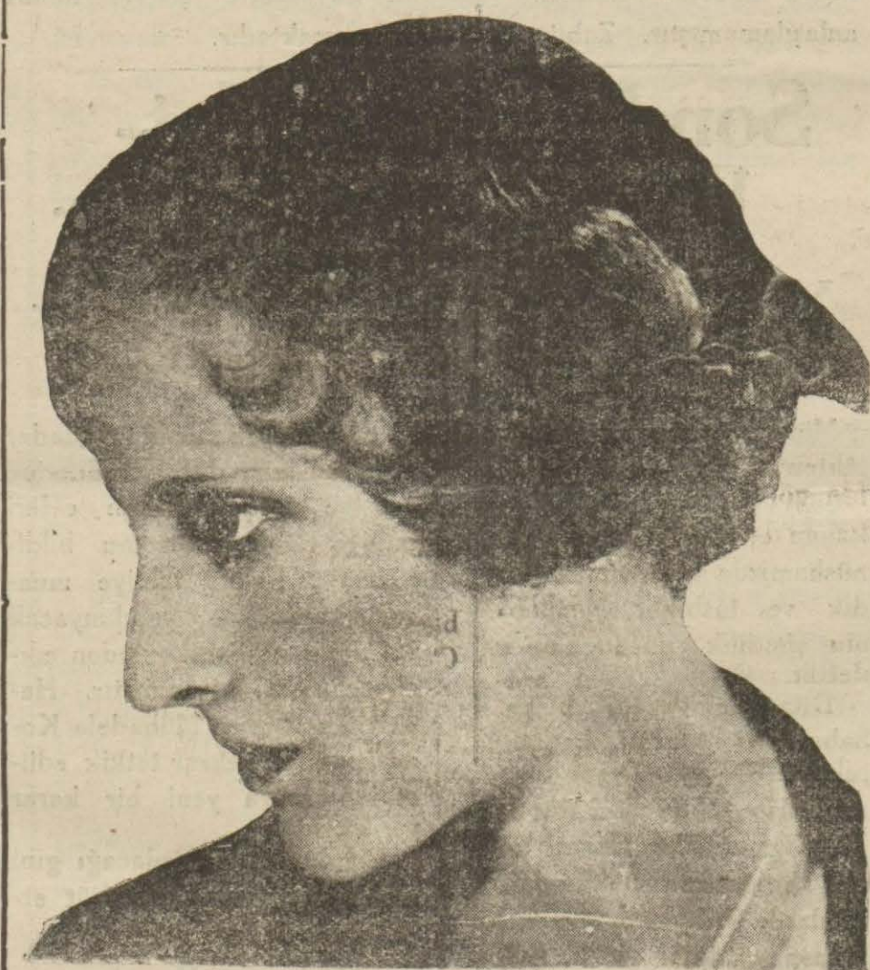
Son Baharda Şapkalar