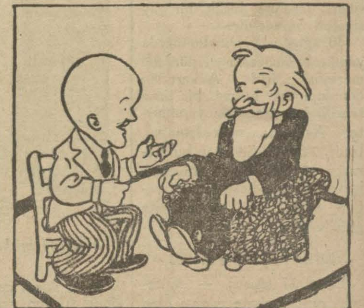
4: Hasan Bey — Yalayıp yutucuları dil işlerine karıştırmamal. Türk dili yutmak için değil, söylemek için yaratılmıştır.